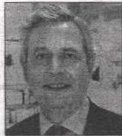
PHILIPPE HOUZÉ Coprésident du directoire des Galeries Lafayette