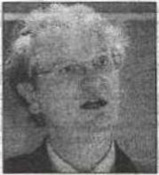
BAUDOIN PROT Directeur général de BNP Paribas